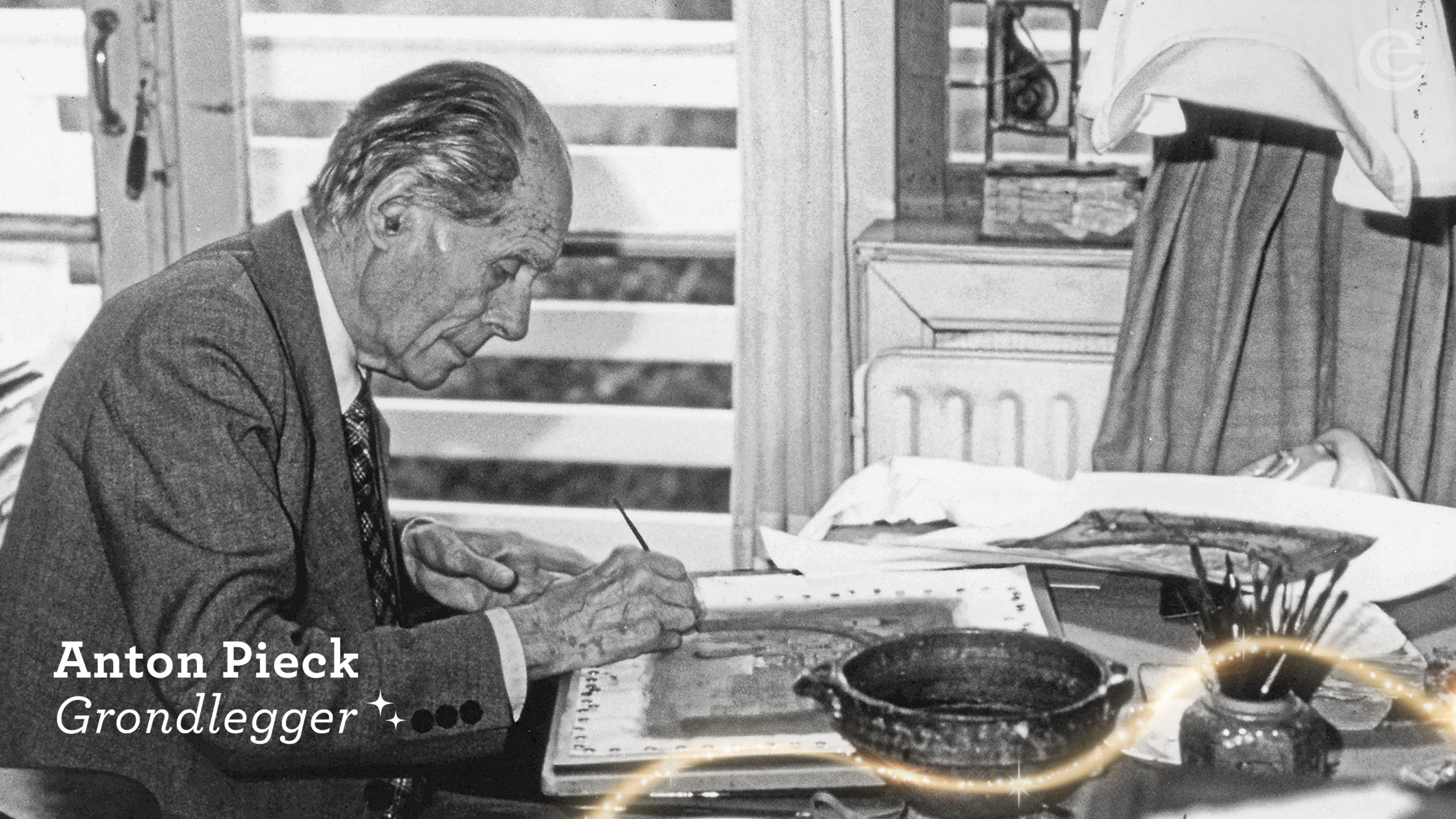
Anton Pieck Grondlegger ✨●●●