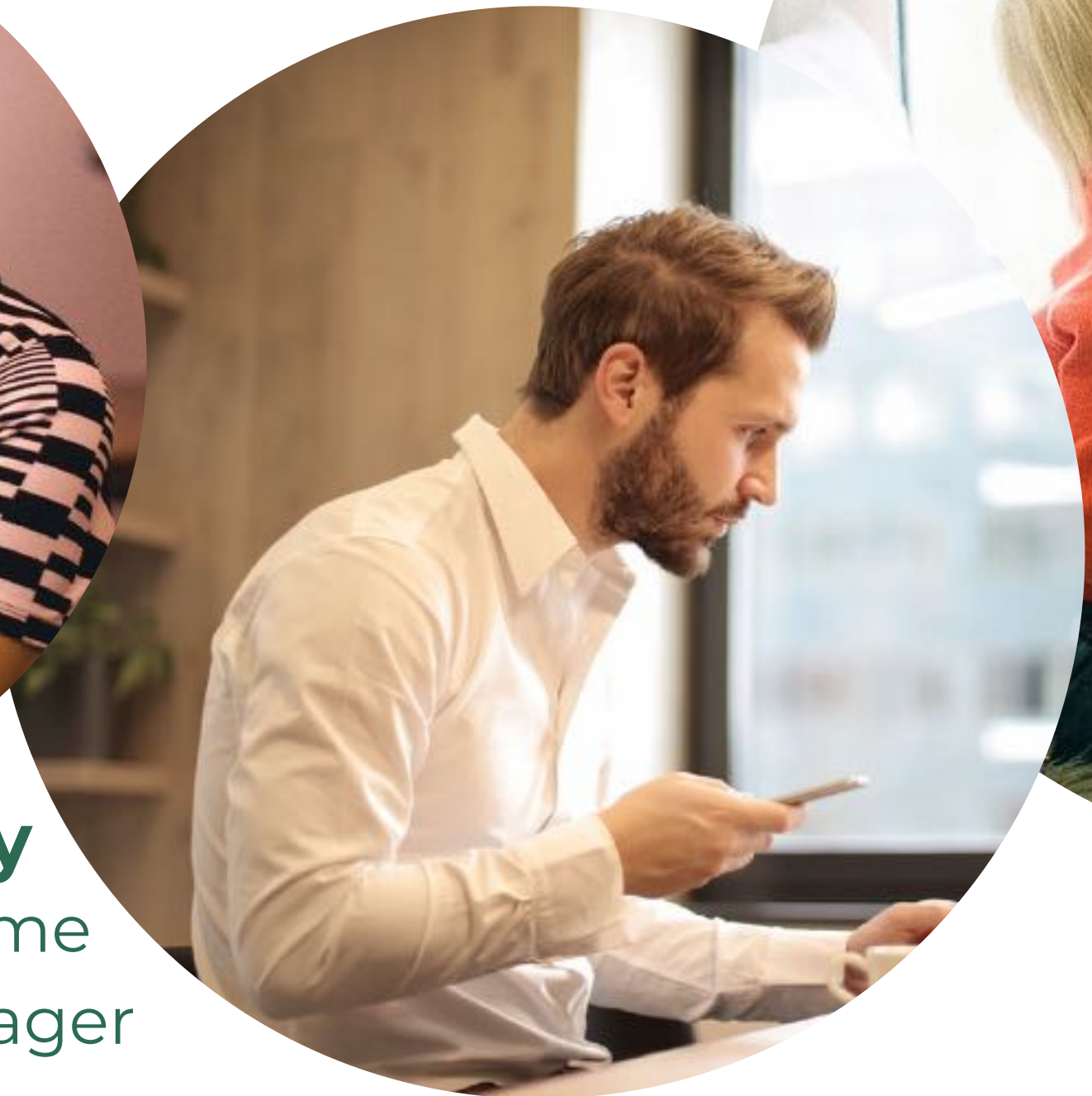
Mathias Familie zakenman